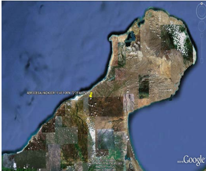
Figura 1. Ubicación del aerodesalinizador en la comunidad Wayúu Uletsumana (Manaure, Guajira, Colombia)

implementación y operación, se ha realizado una actividad constante de monitoreo y documentación utilizando documentos, fotografías y videos, que registran los detalles técnicos, pero que además ofrecen testimonios valiosos del cambio en la vida de la comunidad como efecto del acceso a agua segura que le ofrece el aerodesalinizador.