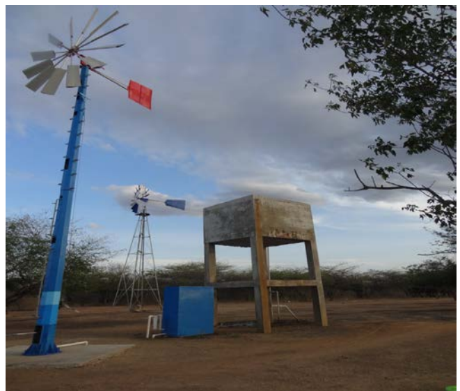
Figura 4. Módulo de la aerobomba

Osmosis inversa. En el proceso que va de los filtros al módulo de bombeo de fuerza eólica, se logra la regulación del caudal y la presión suficiente del sistema; de aquí se envía el fluido de trabajo hacia una membrana de osmosis