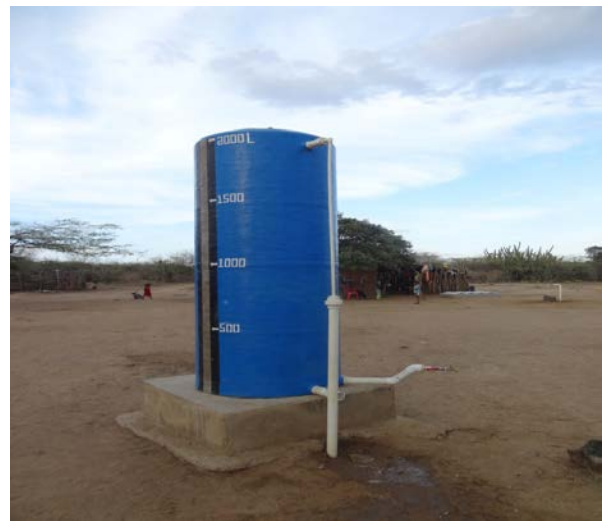
Figura 6. Tanque de almacenamiento de agua potabilizada

Como se indicó, el agua osmotizada de salida, purificada y desalinizada, pasa a un tanque de almacenamiento de agua potable –o de salida–, con una capacidad de 2.000 litros (ver figura 6).