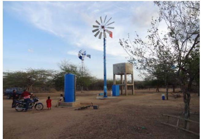
Figura 2. Vista general del sistema aerodesalinizador

El proceso de este sistema de aerodesalinizador tiene seis etapas, como ilustra la Figura 3. Cada una de ellas se describe a continuación.