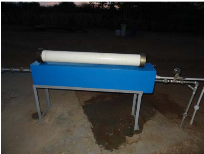
Figura 5. Batería de la membrana

La potabilización y desalinización del agua de salida, atraviesa la membrana de ósmosis inversa, en un rango de presiones a una presión mínima de 220 psi y una presión máxima del sistema a 400 psi. Las válvulas de alivio protegen al sistema de las sobrecargas de presión; el caudal de salida del agua es función de la velocidad del viento. La Figura 5 muestra la batería del módulo de una membrana de ósmosis inversa usada para el proceso de desalinización. La imagen evidencia el manómetro de carátula para medición de la presión de agua a la salida de la membrana y el circuito secundario para la salida de sedimento del proceso.