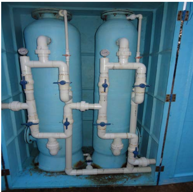
Figura 3. Sistema de filtros confinados

Microfiltración. El filtro de cartucho estándar, de fibra sintética, retiene partículas mayores a cinco micras (5 \mu ), de diatomeas y microalgas, evitando que lleguen a las membranas. Este circuito secundario de agua, cuyos procesos de filtrado eliminan sólidos suspendidos,