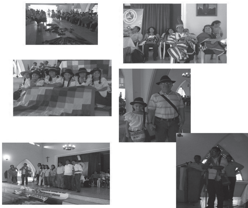
Figura 2. Asamblea y reuniones del cabildo y con otros pueblos

Espacios de talleres: i) Cosmovisión Indígena Yanacona, ii) Formación en Comunicación y Medios, iii) Gobernabilidad y Educación Propia. Los encuentros culturales entre integrantes del Cabildo (Día de la Familia, Inty Raymi). El proceso de construcción de página web del Cabildo Indígena Yanacona de Santiago de Cali, las visitas a territorios de origen y reuniones en Cabildo Mayor Yanacona, la discusión del Plan de Salvaguarda del Pueblo Yanacon.